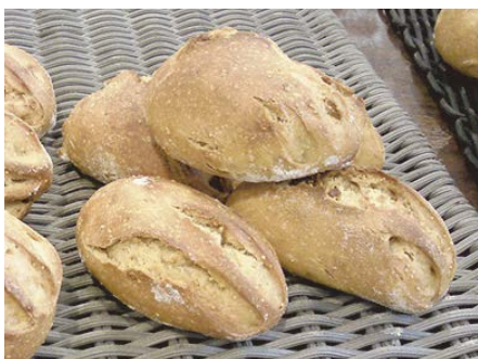
パン・オ・フィグ