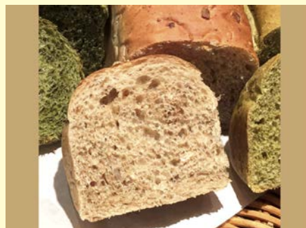
健康パンシリーズ 雑穀