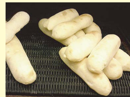
バゲットスモール