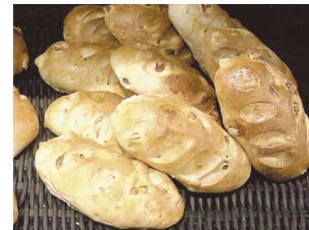
パン・オ・ノア・レーザン