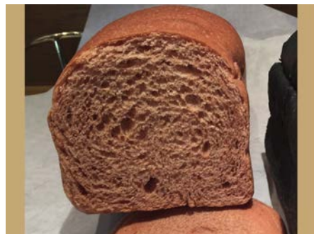
健康パンシリーズ ビーツ