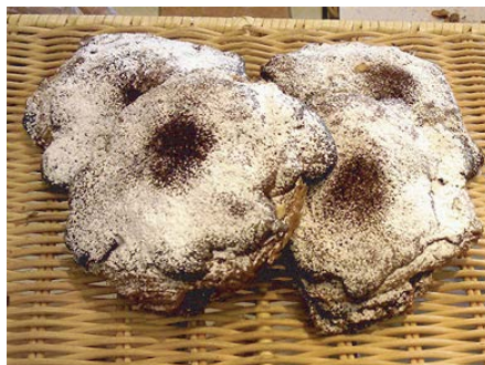
シュコラ・ザ・マンド