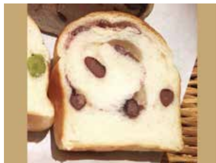
掌のり食パン 大納言