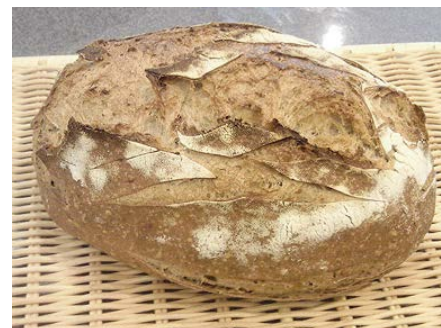
五穀リュスティック