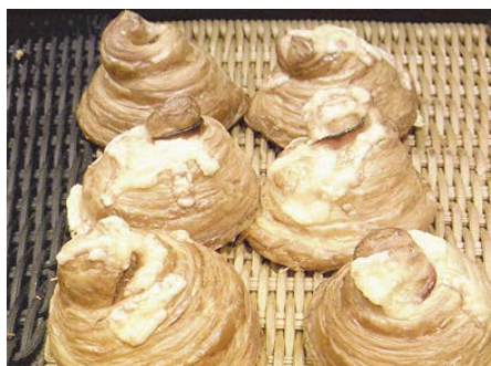
モン・クロワッサン