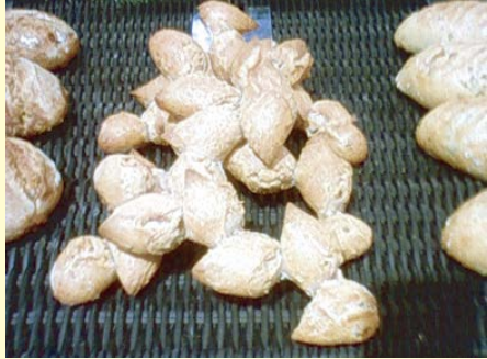
パン・ノア・ラルドン