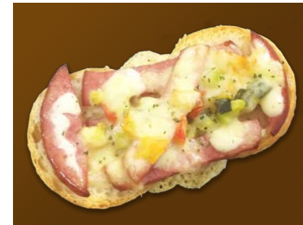
ソフトタルティーン・ボロニア