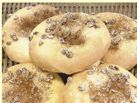
フォイエス・ショコラ