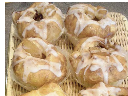
アップル・シナモンロール