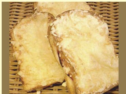
クロック・ムッシュ