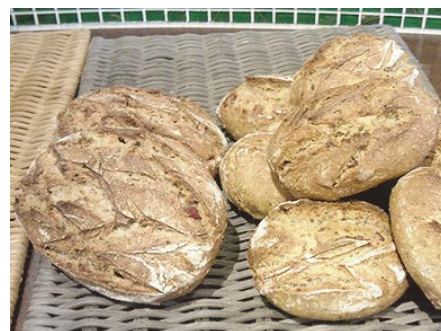
パン・オ・マスタード