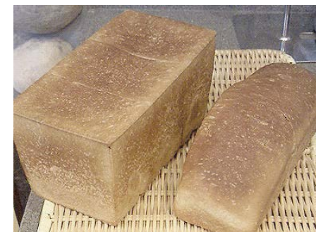
黒糖パン・ド・ミ