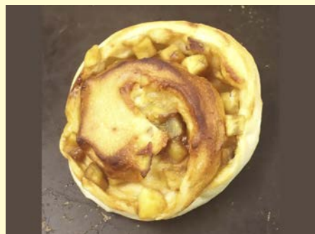
さつま黒糖ロール