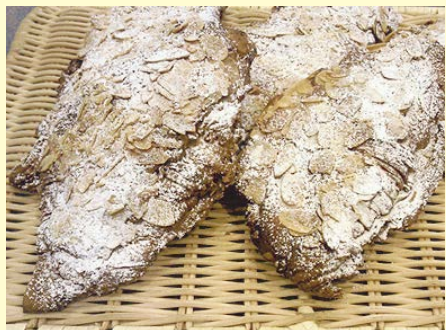
クロワッサン・ザ・マンド