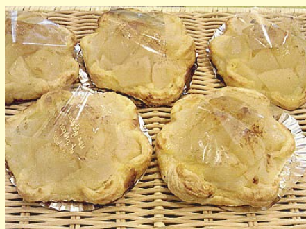
タルト・リュスティック