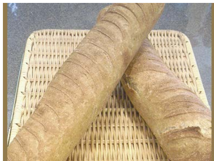
コンブレバゲット