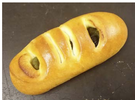
宇治抹茶餡と丹波の黒豆