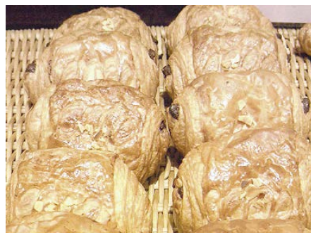
パン・オ・ショコラ