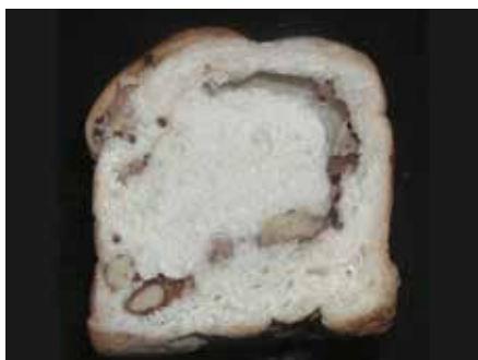
掌のり食パン ベーコン