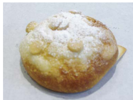
フォイエス・ホワイトチョコ