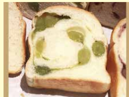
掌のり食パン うぐいす