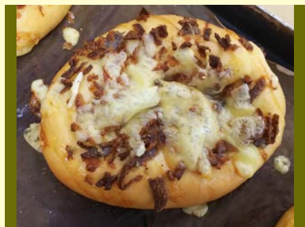
総菜パン アンチョビ・オニオン