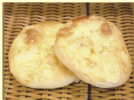
総菜パン 2種のチーズ