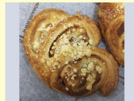
マロン デニッシュ