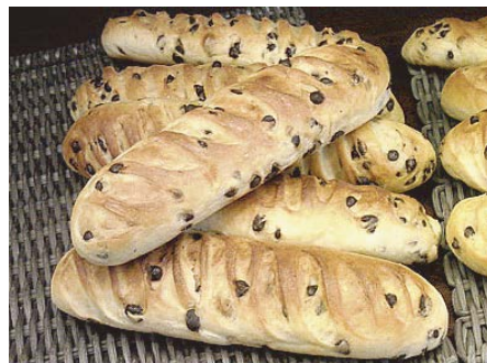
ヴィエノア・ショコラ