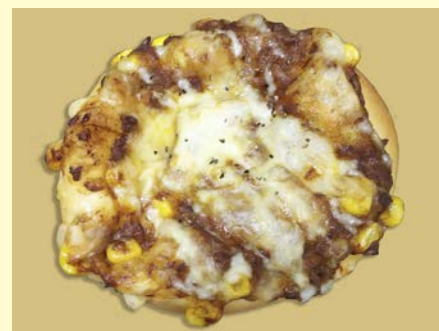
総菜パン キーマカレー