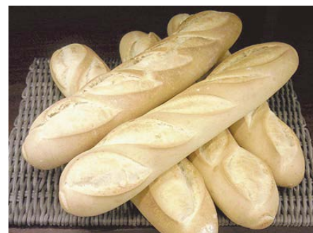
イタリアン・バゲット