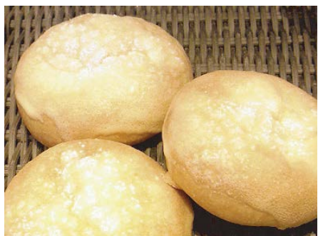
フェイオス・マカロン