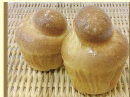
プティブリオッシュ