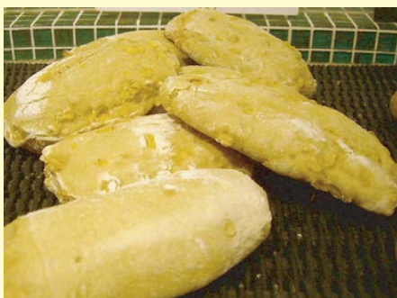
とうもろこしパン