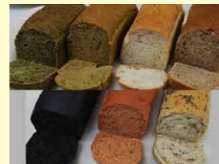
健康パンシリーズ