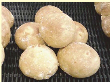
パン・オランジェ