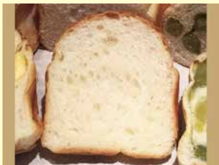
掌のり食パン パン・ド・ミ