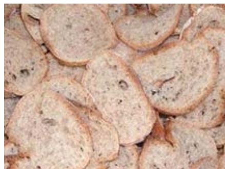
LA Juice パンチップス