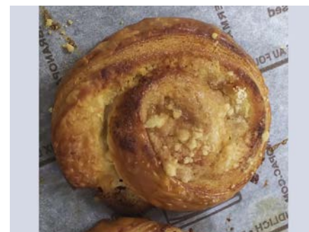
アップル デニッシュ