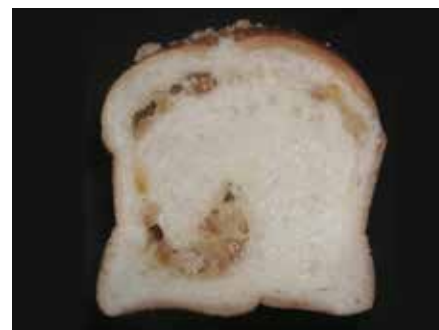
掌のり食パン オランジェ