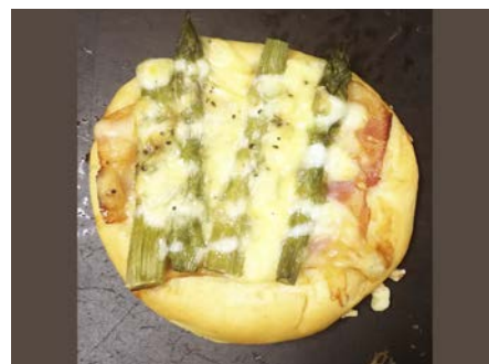
総菜パン ベーコン・アスパラ