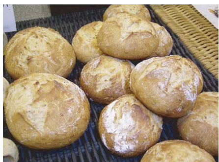
パン・オ・オニオン