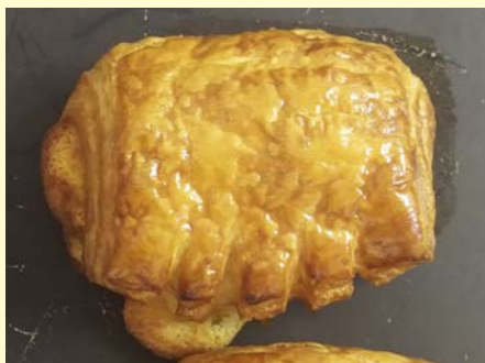
オレンジ デニッシュ