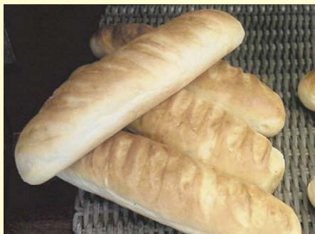
ヴィエノア・ナチュラル