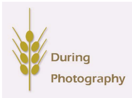
クロック・マダム