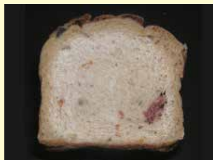
掌のり食パン トマトオリーブ