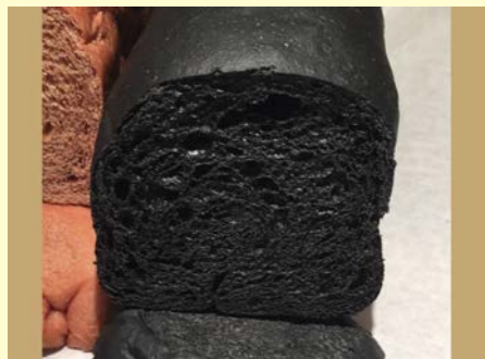
健康パンシリーズ チャコール