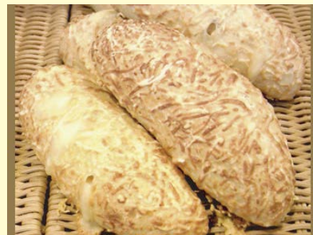
パン・オ・フロマージュ