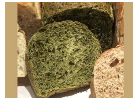
健康パンシリーズ モリンガ