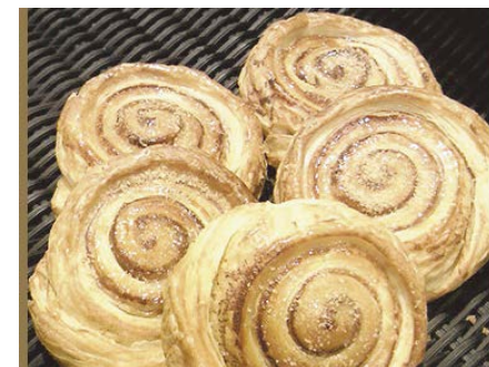
ルーローカーネル