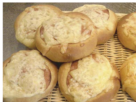
総菜パン スパイシーサラミ