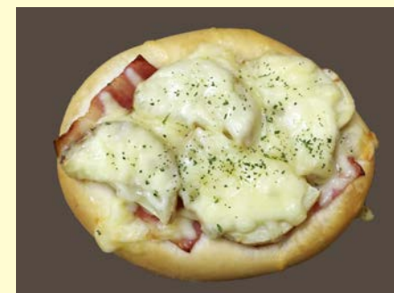
総菜パン ベーコン男爵