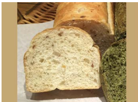
健康パンシリーズ 発芽玄米