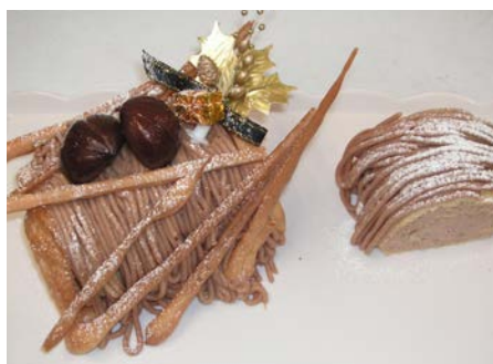
ふたりのクリスマス