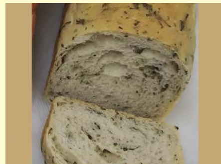
健康パンシリーズ ステビア