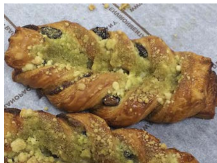
抹茶餡 デニッシュ