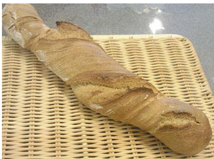
ペイザンバゲット