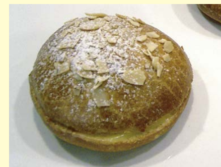
ブリオッシュ ミエール