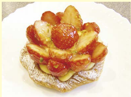
いちごのデニッシュ