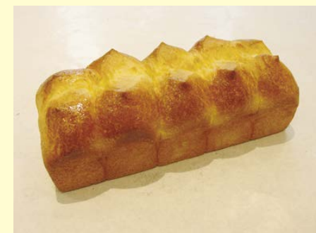
ブリオッシュ ナンテール