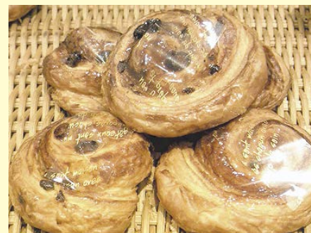
パン・オ・レザン