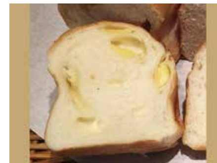
掌のり食パン フロマージュ