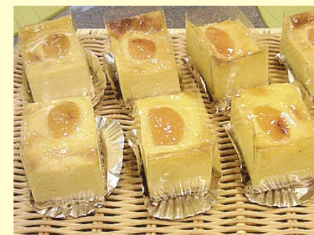
フラン・アプリコット