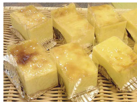
フラン・ナチュラル