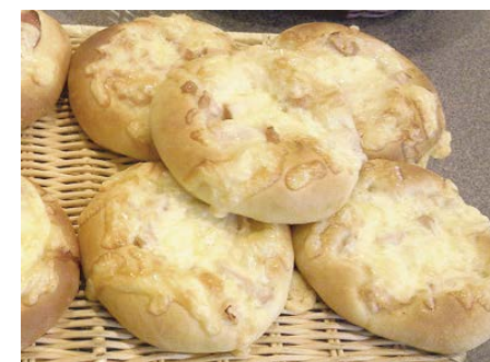
総菜パン スモークチキン